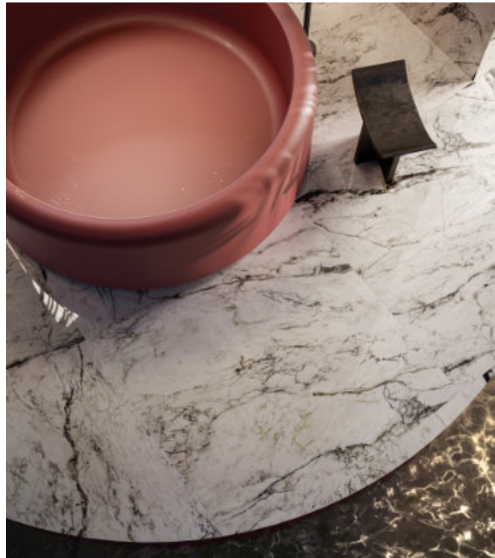
Dream Pure Breccia Capraia 120 × 120